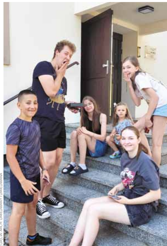
ZDJĘCIA: ARCH-UMIŁOWANY I UMIŁOWANA