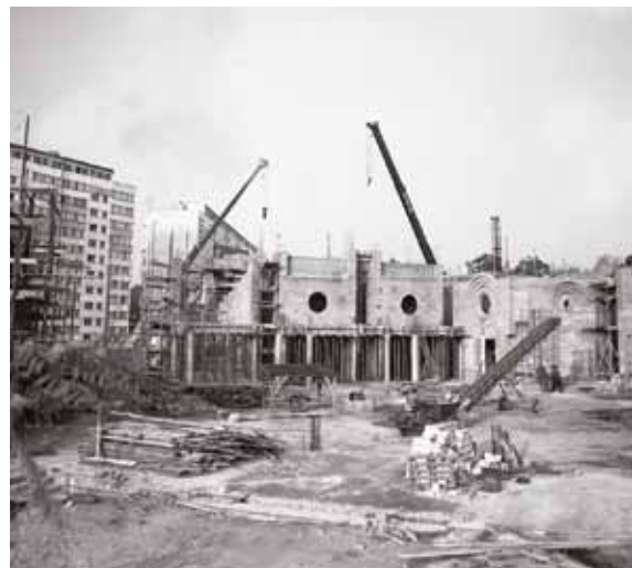
>> Popowice – Budowa prezbiterium, 19 października 1984 r.