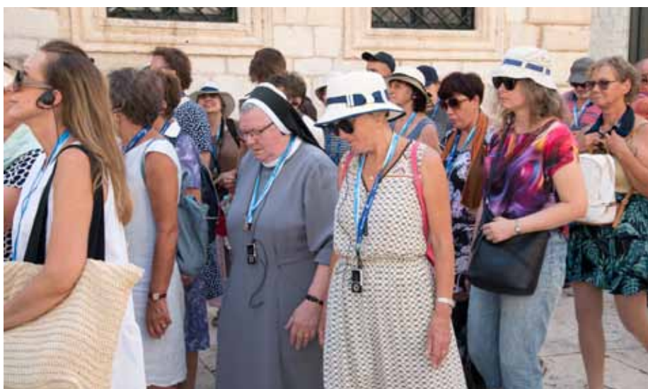
>> Dubrownik – Zwiedzanie starego miasta