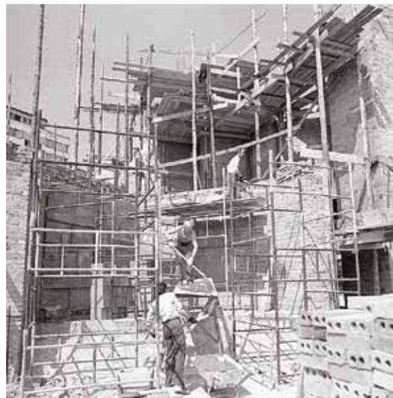
>> Popowice – Prace przy budowie w czerwcu 1984 r.