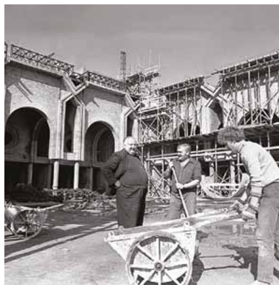
>> Popowice – Stan budowy z 27 października 1986 r.