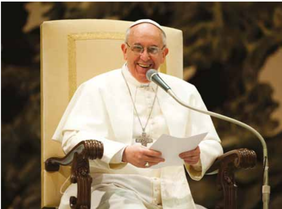
>> Watykan – Papież Franciszek

„ Spes non confundit ”, czyli „Nadzieja zawieść nie może”, to tytuł bulli zapowiadającej nowy rok święty, którą 9 maja tr. papież Franciszek uroczyście odczytał. Papieże co 25 lat ogłaszają rok jubileuszowy zgodnie z wiekową tradycją.