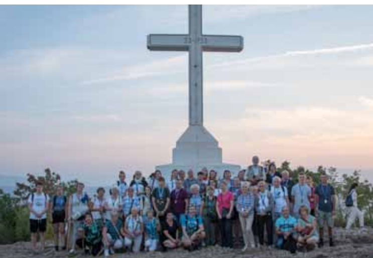
>> Medziugorje – Na szczycie góry Križevac

Kolejny dzień i kolejna podróż. Tihaljina – mała miejscowość położona w regionie Hercegowiny. Jest tutaj kościół św. Eliasza, w którym znajduje się słynna figura NMP, znanej jako „Gospa Tihaljinska” – niezwykle piękna, emanująca spokojem. Tutaj uczestniczyliśmy we Mszy św. koncelebrowanej, której przewodniczył o. Błażej, odmówiliśmy akt oddania się Matce Bożej, a na zakończenie obecne pary małżeńskie mogły odnowić przysięgę. We Mszy