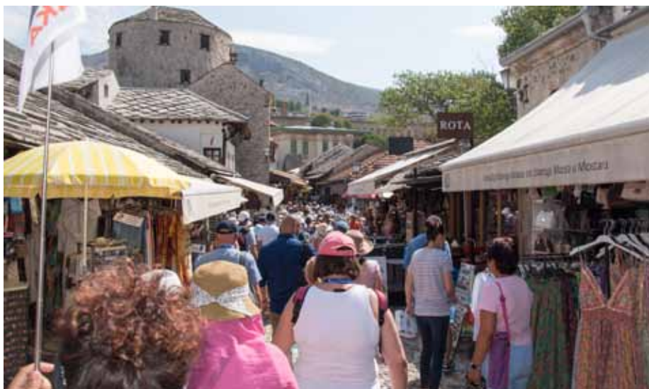
>> Mostar – Zwiedzanie ulicy rzemieślników w towarzyszącym potoku turystów