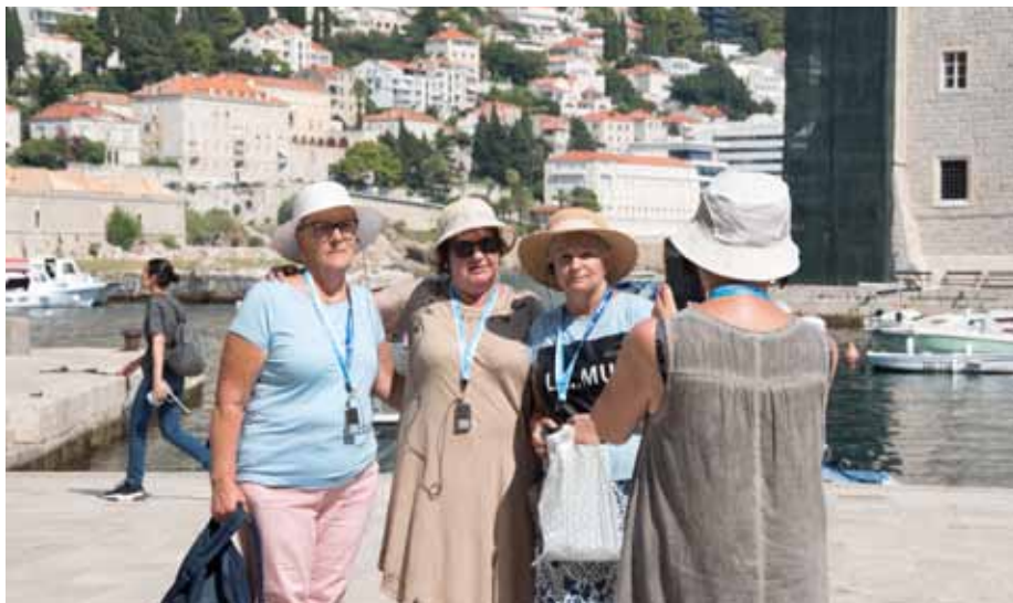
>> Dubrownik – Zwiedzanie starego miasta oraz niezapomniana fotka w porcie