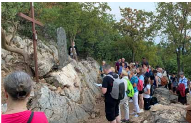
>> Medziugorje – Rozważanie stacji drogi krzyżowej